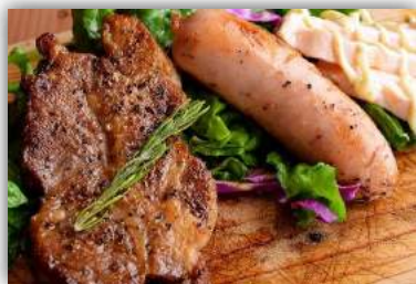
③ イベリコ豚ステーキ