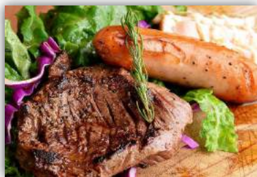
① ビーフステーキ(サガリ)