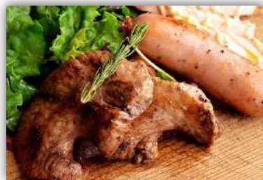
④ マグロホホ肉ステーキ