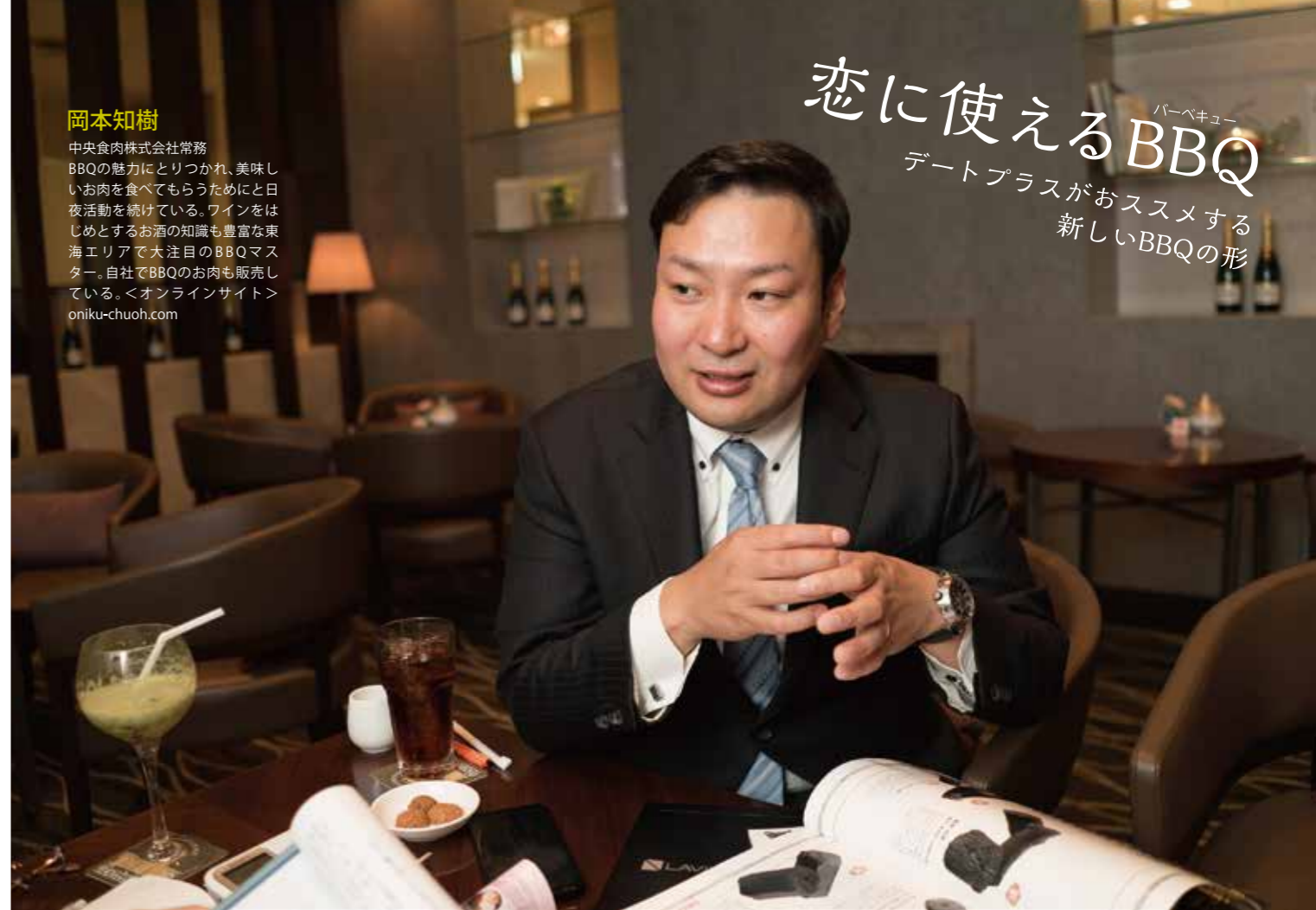
撮影協力/名古屋 東急ホテル アトリウムラウンジ「グリンデルワールド」

バーベキュー BBQはお洒落に楽しむ。 スマートに人と人が繋がる イマドキのBBQを教えます。